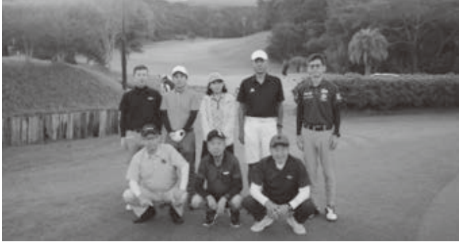
(長崎支部 懇親ゴルフコンペ写真 ※P4記事)